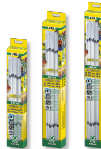
JBL SOLAR Reflect T5/T8 - 895-1500 mm Lámina reflectora para tubo fluorescente solar