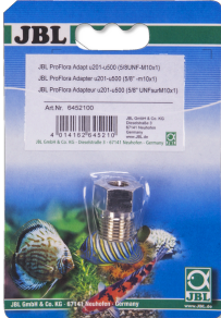
JBL PROFLORA Adapt u201-u500 Adaptador para regulador de presión u201