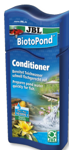
JBL BiotoPond Acondicionador para el agua del estanque