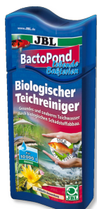
JBL BactoPond Bacterias para la autolimpieza del estanque