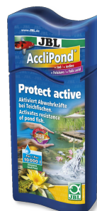
JBL AccliPond Acondicionador para el agua del estanque