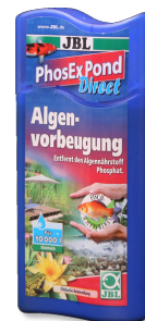
JBL PhosEx Pond Direct Eliminador de fosfatos para el estanque