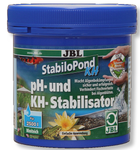
JBL StabiloPond KH Estabilizador del pH para estanques de jardín