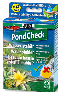
JBL PondCheck Test rápido para determinar el valor del pH y de la KH