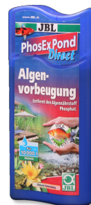
JBL PhosEx Pond Direct Eliminador de fosfatos para el estanque