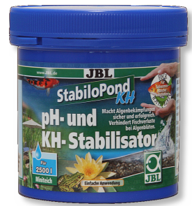
JBL StabiloPond KH Estabilizador del pH para estanques de jardín