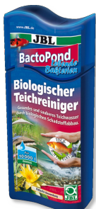
JBL BactoPond Bacterias para la autolimpieza del estanque