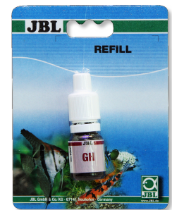
Test JBL GH Test rápido para determinar la dureza general