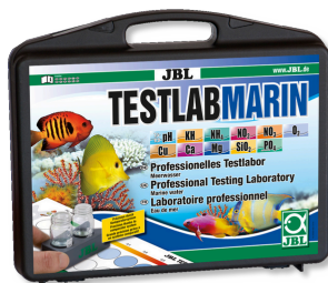
JBL Testlab Marin Maletín tests profesional para analizar el agua salada