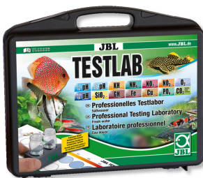
JBL Testlab Maletín con 13 tests para analizar agua dulce Testlab