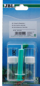
JBL Set de piezas de test para el agua