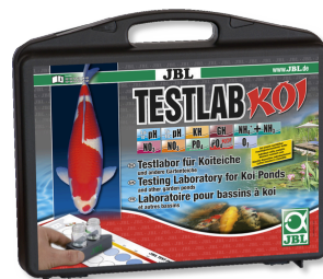
JBL Testlab Koi Maletín de tests profes. p. estanques de kois/jardín