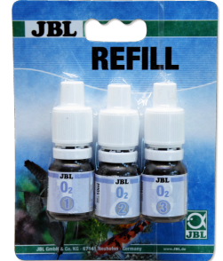
Test de oxígeno JBL O2, fórmula nueva Test rápido para determinar la concentración de O2