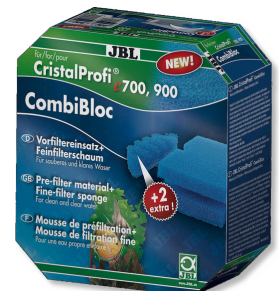
JBL CombiBloc CristalProfi e Material prefiltrante y espuma para CristalProfi e