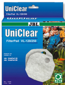
JBL FilterPad VL Filtro de algodón para filtros CristalProfi