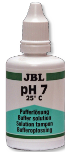
JBL Solución tampón pH 7,0 Líquido calibración con pH 7,0 para electrodos de pH