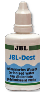
JBL Dest Agua destilada para limpiar electrodos de pH