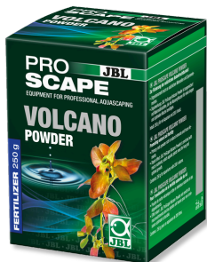
JBL PROSCAPE VOLCANO POWDER Aditivo de largo efecto para acuarios con plantas