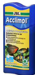
JBL Acclimol Acondicionador para la aclimatación de peces nuevos