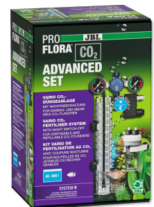
JBL PROFLORA CO2 ADVANCED SET V Kit CO2 + manomètres et électrovanne, SANS BOUTEILLE