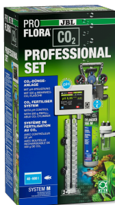
JBL PROFLORA CO2 PROFESSIONAL SET M Kit de fertilisation au CO2 avec régulateur de CO2