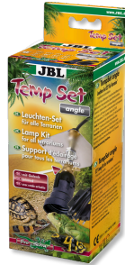
JBL TempSet angle Installation kit for lamps in terrariums