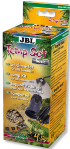
JBL TempSet basic Installation kit for lamps in terrariums