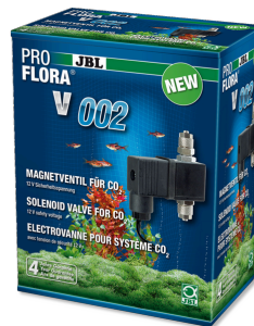
JBL PROFLORA v002 Électrovanne silencieuse