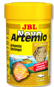
JBL NovoArtemio Complément d'artémias pour tous poissons d'aquarium