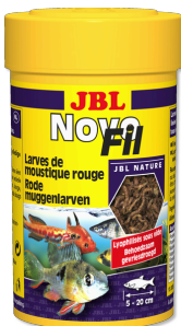
JBL NovoFil Larves de moustiques rouges pour poissons d'aquarium