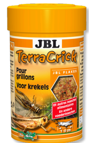
JBL TerraCrick Aliment complet pour insectes alimentaires