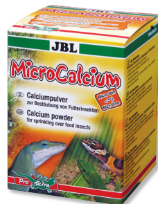
JBL MicroCalcium Complément alimentaire de minéraux pour tous reptiles