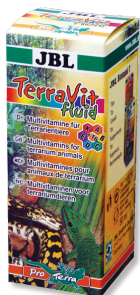
JBL TerraVit fluid Vitamines et oligoéléments pour animaux de terrarium