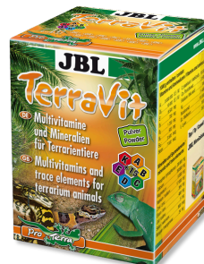
JBL TerraVit Vitamines et oligoéléments pour animaux de terrarium