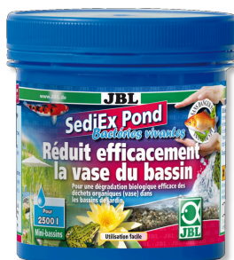
JBL SediEX Pond Bactéries et oxygène actif pour dégrader les boues