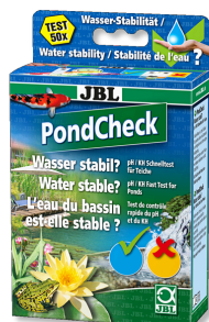
JBL PondCheck Test rapide pour la détermination du pH et du KH