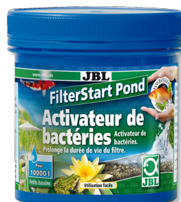
JBL FilterStart Pond Activateur de bactéries pour filtre de bassin