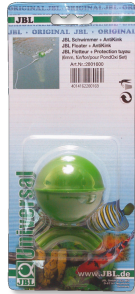
JBL Flotteur + anticoûde

Flotteur avec protection anti- côude pour kit PondOxi