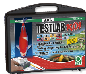
JBL Testlab Koi Coffret de tests professionnel pour bassins