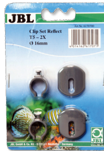
JBL SOLAR REFLECT Kit clips Fixation pour tubes fluorescents