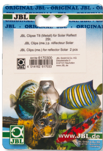
JBL Clips T5/T8 (Métal) Fixation en métal pour tubes fluorescents