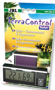
JBL TerraControl Solar Thermomètre/hygromètre solaire pour tous terrariums