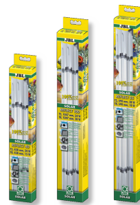
JBL SOLAR Reflect T5/ T8 (895-1500 mm) Réflecteur pour tube fluorescent SOLAR