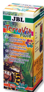
JBL TerraVit fluid Vitamines et oligoéléments pour animaux de terrarium