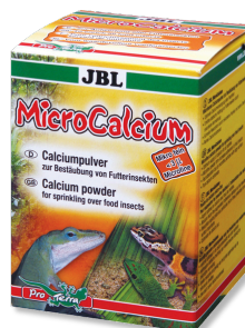
JBL MicroCalcium Complément alimentaire de minéraux pour tous reptiles