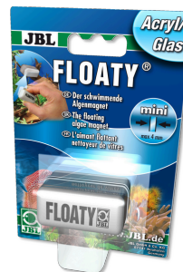
JBL FLOATY Verre/Acrylique Aimant flottant nettoyeur de vitres acryliques