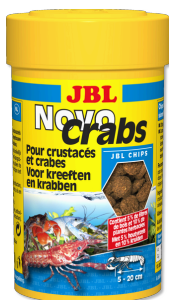
JBL NovoCrabs Aliment de base en comprimés pour crustacés