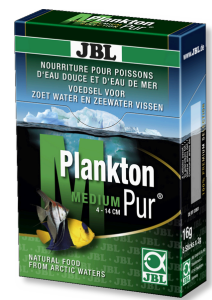
JBL PlanktonPur MEDIUM Friandises pour grands poissons d'aquarium