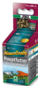
JBL NanoCrabs Aliment de base pour écrevisses naines