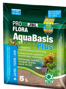
JBL PROFLORA AquaBasis plus

Fertilizante para plantas para acuarios de agua dulce