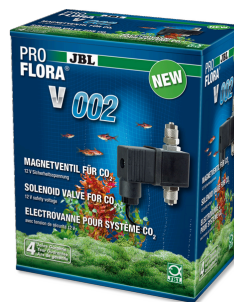
JBL PROFLORA v002 Válvula electromagnética silenciosa