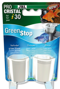
JBL PROCRISTAL i30 GreenStop Material filtrante especial contra el agua verde