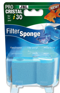
JBL PROCRISTAL i30 FilterSponge Esponja filtrante de recambio para ProCristal i30