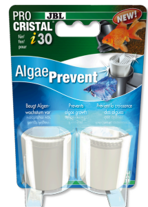
JBL PROCRISTAL i30 AlgaePrevent Cartucho contra las algas en el acuario