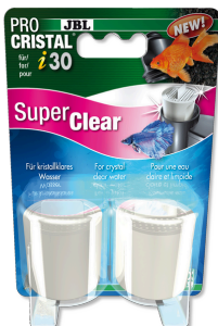
JBL PROCRISTAL i30 SuperClear Carbón activo de alto rendimiento para agua cristalina