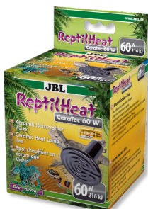
JBL ReptilHeat Lámpara calefactora de cerámica