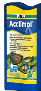
JBL Acclimol Acondicionador para la aclimatación de peces nuevos