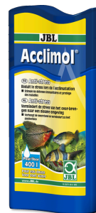
JBL Acclimol Acondicionador para la aclimatación de peces nuevos