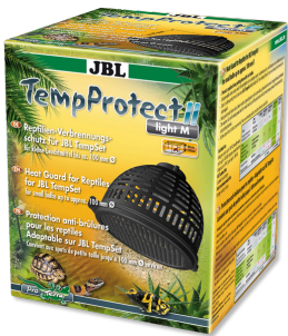
JBL TempProtect II light Protector contra quemaduras reptiles para JBL TempSet