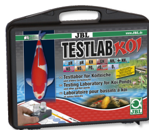
JBL Testlab Koi Maletín de tests profes. p. estanques de kois/jardín