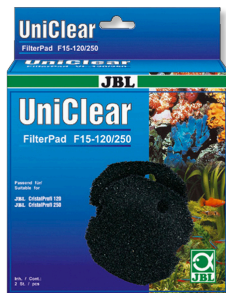
JBL FilterPad F15

Filtro de algodón para filtros CristalProfi