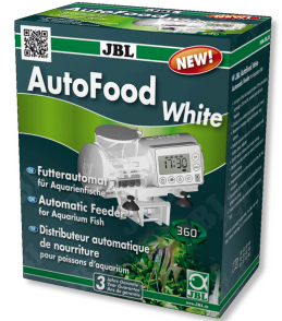
JBL AutoFood WHITE Comedero automático blanco para peces de acuario