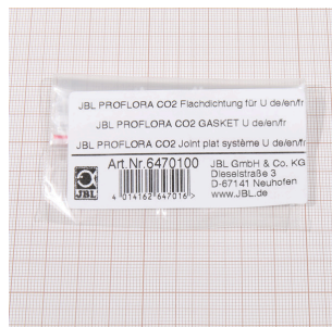
JBL PF CO2 плоское уплотнение для U