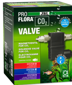
JBL PROFLORA CO2 VALVE Магнитный вентиль CO2 для контролируемой подачи CO2