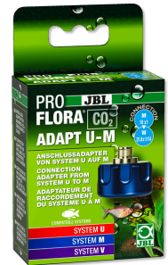
JBL PROFLORA CO2 ADAPT U - M Адаптер CO2 д/переоснащ. с одно- на многораз. баллоны