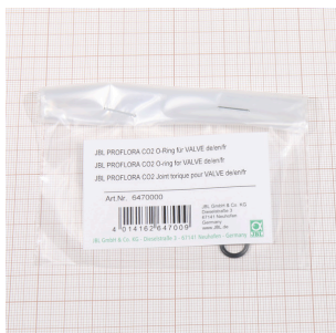
JBL PF CO2 уплотн. кольцо для VALVE