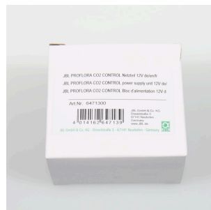
JBL PF CO2 CONTROL блок питания 12 В