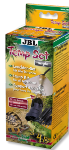
JBL TempSet angle Комплект для установки ламп в террариуме