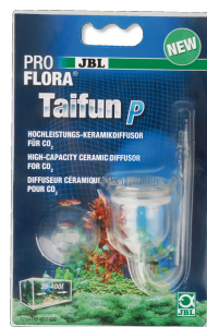
JBL ProFlora Taifun P Миниатюрный CO2-диффузор для пресноводных аквариумов