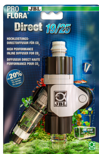
JBL ProFlora Direct Эффективный непосредственный диффузор для CO2