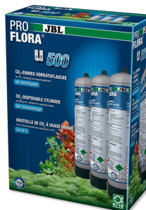
JBL PROFLORA 3 x u500 Сменный одноразовый CO2 баллон