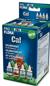
JBL PROFLORA Cal Комплект для калибровки