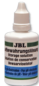
JBL Storage Solution Раствор для чистки и хранения pH-электродов