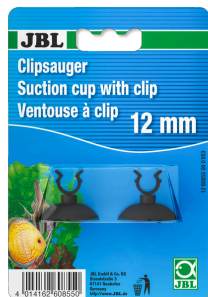
JBL suction cup with clip, 12 mm

Резиновая присоска с зажимом для предметов диаметром 12 мм