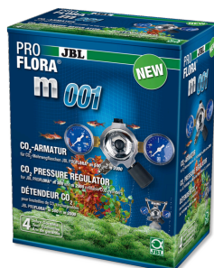
JBL PROFLORA m001 Редуктор давления