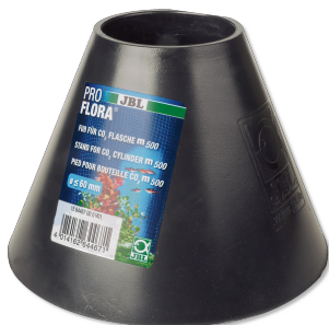
JBL PROFLORA подставка д/запасн. баллона CO2 500 г Подставка для CO2-баллона