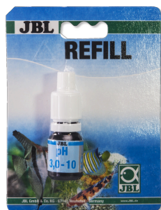
JBL pH 3,0-10,0 тест Экспресс-тест для определения значения pH