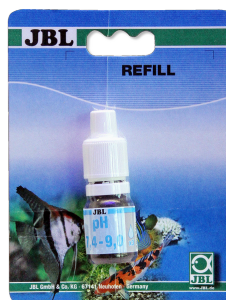
JBL pH 7,4-9,0 тест Тест pH в диапазоне 7,4-9,0 для аквариумов и прудов