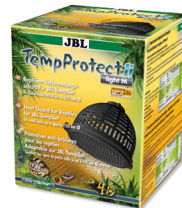
JBL TempProtect II light Защита от ожогов у рептилий для JBL TempSet