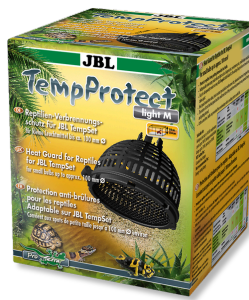
JBL TempProtect light Защита от ожогов у рептилий для JBL TempSet