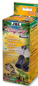
JBL TempSet basic Комплект для установки ламп в террариуме