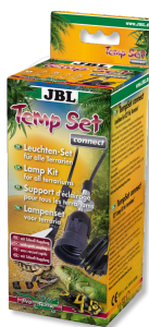
JBL TempSet connect Комплект для установки с разъёмным соединением