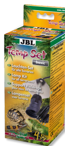
JBL TempSet basic Комплект для установки ламп в террариуме