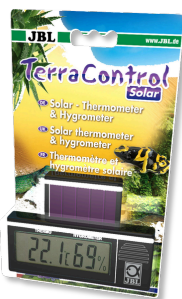
JBL TerraControl Solar Термометр и гигрометр для любых террариумов