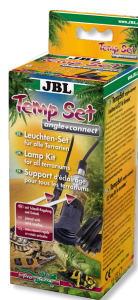
JBL TempSet angle+connect Комплект для установки ламп в террариуме