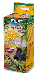
JBL TempSet angle Комплект для установки ламп в террариуме