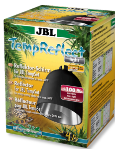
JBL TempReflect light Рефлектор для энергосберегающих ламп