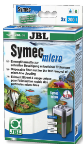
JBL SymecMicro Микроволокно для аквариума против помутнения воды