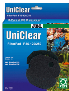
JBL FilterPad F35 Губка тонкой фильтрации для CristalProfi