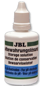
JBL Storage Solution Раствор для чистки и хранения pH-электродов