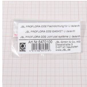
JBL PF CO2, joint plat pour U