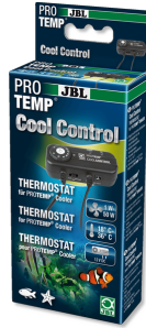
JBL PROTEMP CoolControl Thermostat de commande pour refroidisseurs