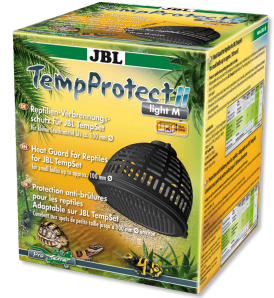
JBL TempProtect II light Protection antibrûlure pour reptiles pour JBL TempSet