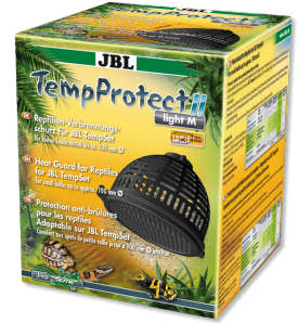
JBL TempProtect II light Protection antibrûlure pour reptiles pour JBL TempSet