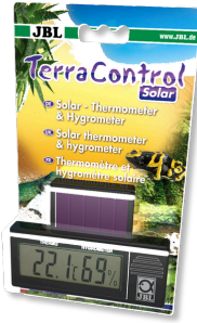
JBL TerraControl Solar Thermomètre/hygromètre solaire pour tous terrariums