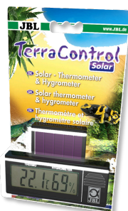
JBL TerraControl Solar Thermomètre/hygromètre solaire pour tous terrariums