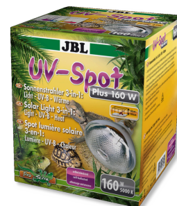
JBL UV-Spot plus

Spot halogène à spectre complet de lumière naturelle