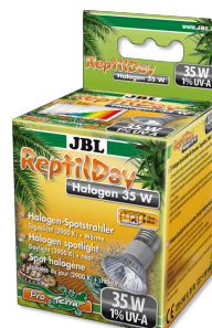
JBL ReptilDay Halogène

Tube T8 de terrarium pour animaux des déserts