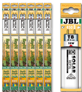
JBL SOLAR REPTIL JUNGLE T8

Tube T8 de terrarium pour animaux de forêts tropicales