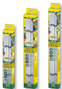
JBL SOLAR Reflect T5/ T8 (895-1500 mm) Réflecteur pour tube fluorescent SOLAR